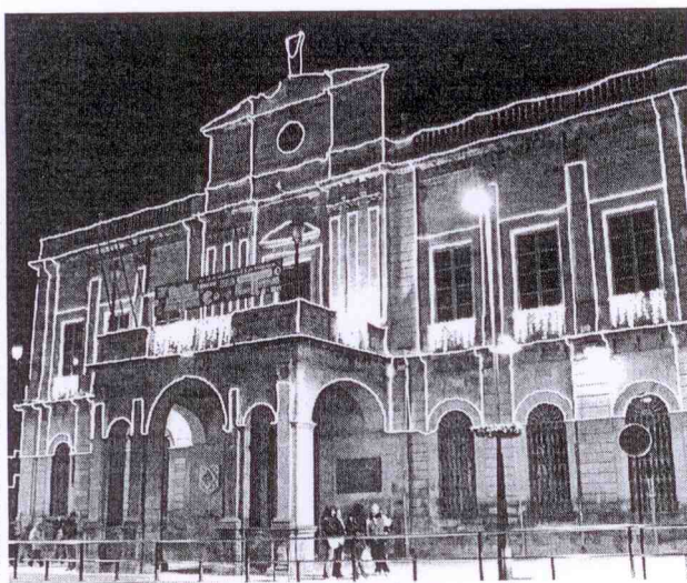
Iluminación de la fachada del Palacio Consistorial de Linares.

Algunas ya clásicas también, como el pasacalles, se han visto renovadas. Así, entre las novedades de esta edición, del