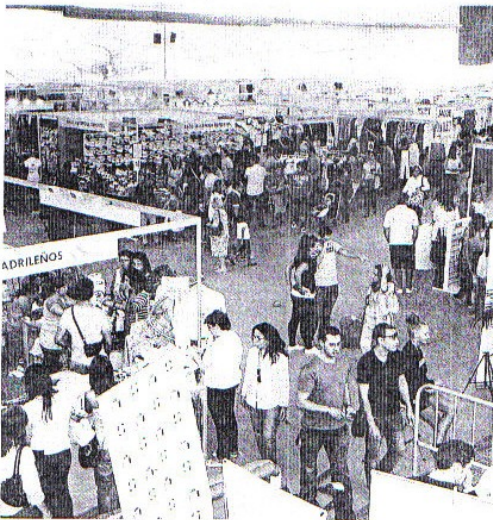
Panorámica de la Feria de Saldos. ENRIQUE

giosos. Happy, Globel, Muriel, Solo, Draks, Cool y Charada aprovechan estas jornadas para liberar espacio en sus almacenes. «Otra cosa es que sea rentable, porque en realidad si vendo un artículo que me ha costado cincuenta por diez euros, en realidad lo que hago es regalarlo, pero para los pequeños comerciantes disponer de todo el espacio en nuestro establecimiento es vital y solo por eso merece la pena», explica la propietaria de Happy.