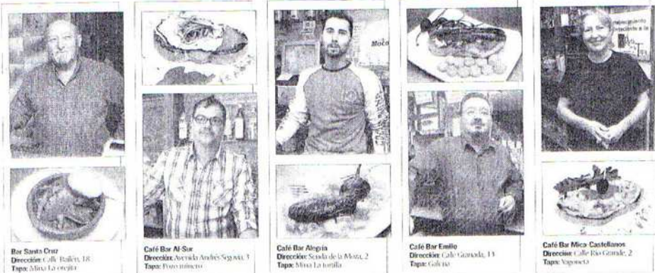
Bar Santa Cruz Dirección: Calle Balboa, 18 Tapa: Minca La orella