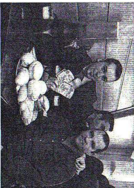
VARIEDAD. Hay 23 tapas diferentes.