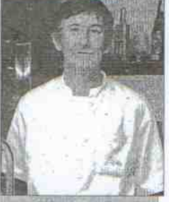
Café Bar Jaybo Dirección: Ctra. de Arrayanes, 11 Tapa: Chilitos de cocedero