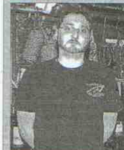
Taberna La Carboneria Dirección: calle Zabala, 9 Tapas: Trigos