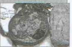
Cafetería Isaac Peral Dirección: calle Isaac Peral, 36 Tapa: Habichuelas con oreja