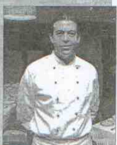
Restaurante Manolito Dirección: calle Julio Burell, 22 Tapas: Crema de patata con cebolla