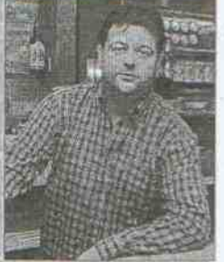
Café Bar Al-Sur Dirección: calle Baños, 2 Tapa: Patatas San Andrés