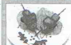
Cafetería Bowling Linares Dirección: calle Julio Burell, 1 Tapas: Brocheta de hígado y manzana