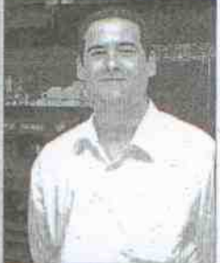
El Cocedero Andaluz Dirección: Avda. San Cristóbal, 1 Tapa: Jamón a la catalana