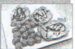
La Cazuela Dirección: calle Carolina, 1 Tapa: Lomo con maíz