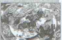
Restaurante La Casa de Josopi Dirección: calle Ventura de la Vega Tapa: Pincho de jamón asado