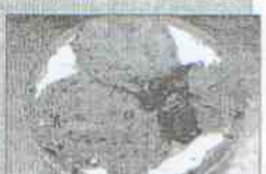
Restaurante Asador Río Grande Dirección: calle Río Grande, 1 Tapa: Mariscos desmenuzados