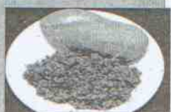
Café Mañás Don Jamón Dirección: Avenida de España, 87 Tapa: Picadillo de chorro casero