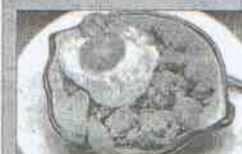
Café Bar Santa Cruz Dirección: calle Bailén, 18 Tapas: Salsita de fideos con jamón