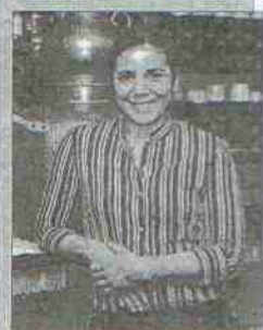
Cafetería La Tortuga Azul Dirección: Centro Comercial Alcarroz Tapa: Fajita de calamar