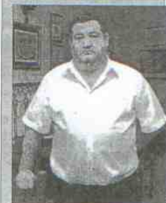
Cervecería Joga-Lusa Dirección: calle Rapiñael, 1 Tapas: Rollito de langostino