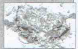
Chilango Bar Dirección: calle Bolívar, 51 Tapa: Quesadilla de champiñón