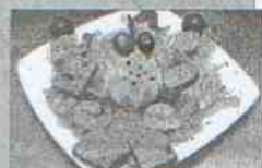
Café Bar Versailles Dirección: Plaza Aníbal e Híndler, 3 Tapas: Capriccio