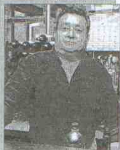
Bar Emilio Dirección: calle Granada, 13 Tapa: Hambony