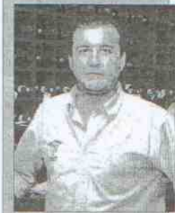
Taberna La Espoela de Pachis Dirección: calle Tinte, 25 Tapa: Tortillita con bacalao