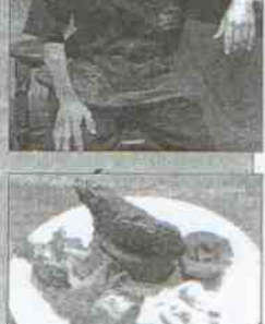
Cervecería Restaurante El Ancla Dirección: calle Julio Burell, 30 Tapas: Hamengullo