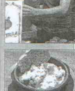
Bar La Canterilla Dirección: calle Julio Burell, 65 Tapas: Gazpacho de pechuga