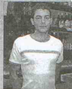
Mesón El Establo Dirección: calle Cervantes, 8 Tapas: Pastel de tortilla relleno