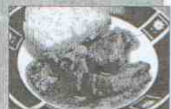
Taberna de La Abuela Dirección: calle Tinte, 36 Tapa: Lomo de cerdo