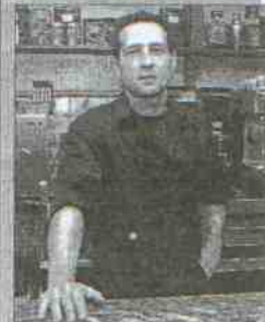
Café Bar Castulo Dirección: Avenida Andalucía s/n Tapas: Círculo